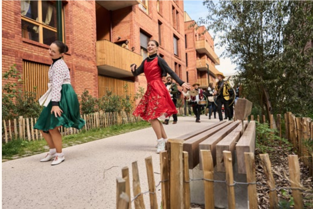
Inauguration de la ZAC Écoquartier Victor Hugo

À 5 minutes à pied de la station Lucie Aubrac (ligne 4) , le Haut Bois permet de rejoindre Châtelet - Les Halles en 20 minutes .